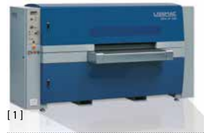
[ 1 ]